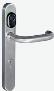
Kaba c-lever Türbeschlag mit TouchGo und RFID- Funktion

Auch hier bleiben keine Wünsche offen, denn der Kaba c-lever mit Kaba TouchGo- sowie RFID-Funktion wird nahtlos in die bestehenden Kaba Sicherheitskonzepte eingebunden. Ihr System bleibt so sicher, wie es bereits war: Kaba TouchGo ist eine Komfortoption, die keinen Einfluss auf Ihr Sicherheitsdispositiv hat und höchsten Investitionsschutz garantiert.