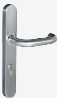
Kaba c-lever Türbeschlag mit TouchGo-Funktion

Das oberste Ziel jedes Schließsystems ist Sicherheit. Diese ist bei Kaba TouchGo in höchstem Mass gegeben, denn ein verloren gegangenes Benutzermedium wird rasch und einfach gesperrt. So werden gleichzeitig Sicherheitslücken und auch das kostenintensive Ersetzen ganzer Schließanlagen vermieden. Neben dem neuen Komfort ist dies ein weiterer wesentlicher Vorteil des elektronischen Zutrittsystems.